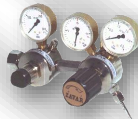
Slika 3. DVO-0 za Helij