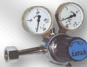
Slika 1. K-0