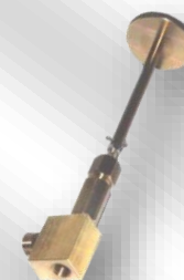
Slika 3. VZS-4K podaljšana verzija