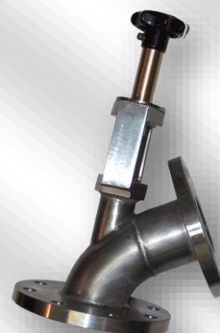
Slika 1. VZS-80K