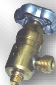
Slika 2. VZS-10K