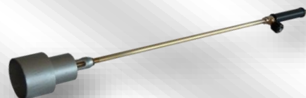
Slika 2. GP-5