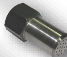
Slika 5. ZP 20K