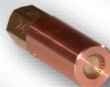
Slika 4. O-24