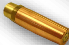
Slika 2. O-1 8-14/2