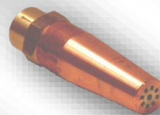
Slika 1. O-1 special 8PB

T* - namestitev na plamenik TELEOPTIK, navojni priključek M14x1,5