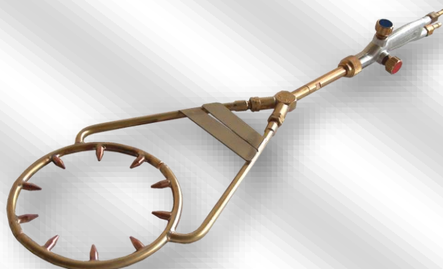
Slika 1. OG-PK-C-1