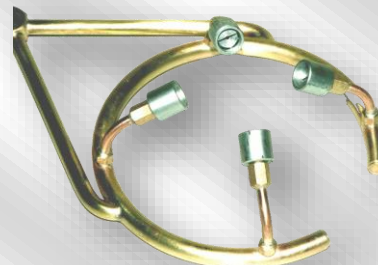
Slika 1. OG-Z19C-1