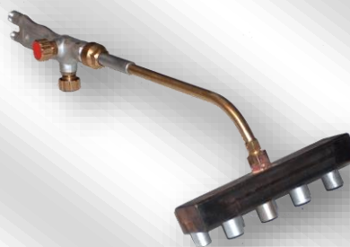
Slika 2. OG-PZ-Z19-D150 – narejen po naročilu