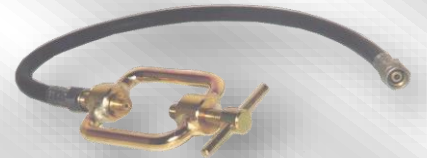
Slika 1. F A