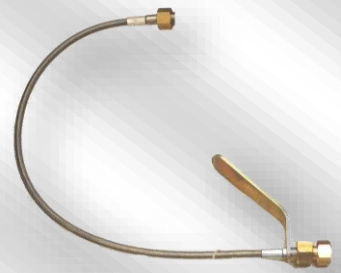
Slika 1. F TF 2