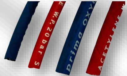
Slika 1. F GUM-1